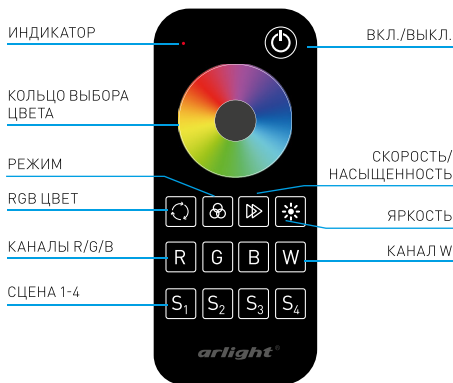
Рис. 1. Пульт ДУ.